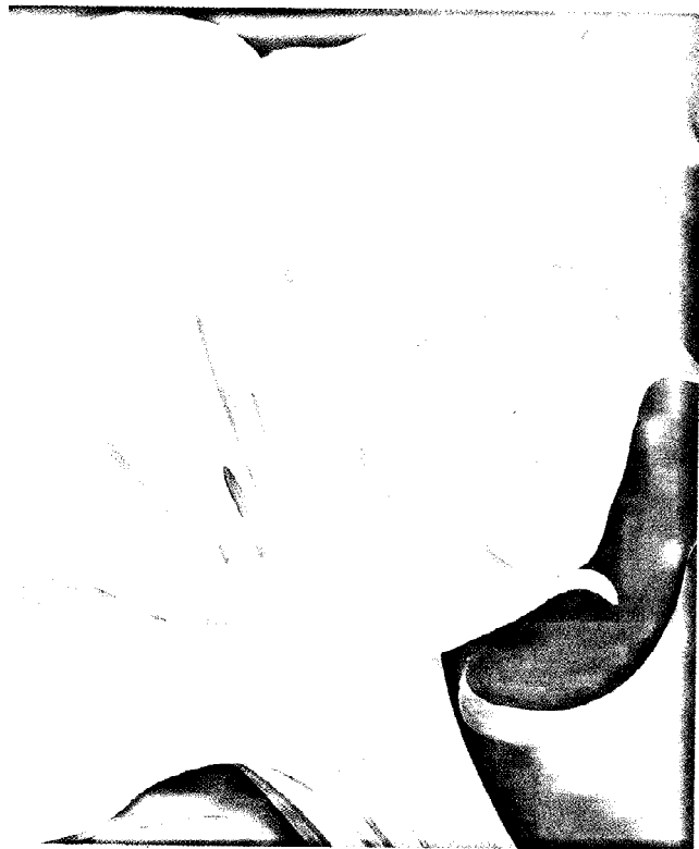
7/97 Die Blumenbilder von Georgia O'Keeffe zeigen die Blüten voluminös von ihrer sinnlichen betörenden Seite, fleischlich und üppig in der Farbigkeit. Die »Weiße Trompetenblume« mit ihrem weit geöffneten Kelch scheint Düfte zu verströmen wie sie umgekehrt als Trichter von verschlingender Anmutung ist. San Diego Museum of Art

hoher Konzentration hat es für uns einen ekelerregenden Geruch. Diese Hedonik der Duftwahrnehmung verweist auf das genetisch festgelegte Artgedächtnis, das über die im DNS-Molekül gespeicherte Information die Verknüpfung der Nervenzellen im Gehirn so steuert, dass nicht nur Düfte erkannt werden, sondern ihnen auch Qualitäten (angenehm, unangenehm) angeborenermaßen, also ohne Erfahrung, zugeordnet werden. Diese genetische Steuerung der Duftwahrnehmung wird auch bei angeborener Duftblindheit deutlich. So können zum Beispiel 2 Prozent der Bevölkerung keinen Schweißgeruch und 33 Prozent kein Kampher riechen. Diesen Menschen fehlen die geeigneten Duftrezeptoren. Es gibt eine ganze Reihe solcher Duftblindheiten. Andere Leistungen des Riechsystems weisen auf die große Bedeutung der Erfahrung mit Düften hin, mitunter schon ganz früh in der Entwicklung. Kaninchen werden zum Beispiel schon vor der Geburt auf bestimmte Futterpflanzen geprägt, die die Mutter aufnimmt. Diese werden